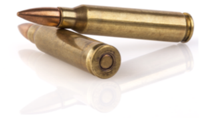
Doc. 4 Balle de fusil.

Pour les distances courtes, la trajectoire de la balle est rectiligne. Pour le tir à 300 m, la trajectoire est plutôt courbe.