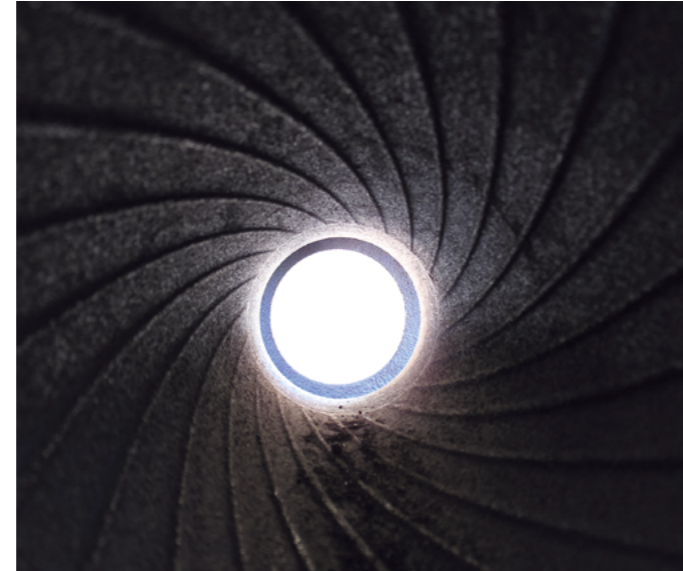
Doc. 2 Les rainures d'un canon.